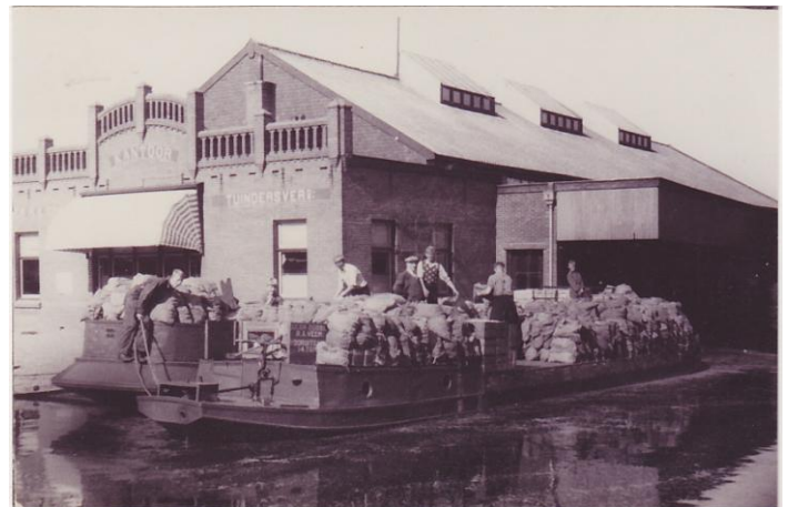
'De Vooruitgang' en de 'Niets Zonder God's Zegen' bij de veiling E.M.M.

In Roelofarendsveen werden de groenten door de tuinders aangeleverd op de veiling E.M.M., die in 1918 was opgericht. Daar werden ze ingekocht en vervolgens naar de klanten vervoerd. De afrekening verliep via de veiling. Omdat de veiling erg veel werk met zich meebracht werd er een tweede schip aangekocht. Dit schip werd gebouwd door scheepsbouwer Boot uit Woubrugge en 'Niets Zonder God's Zegen' gedoopt. Al snel bleek dit schip te klein te zijn voor alle vracht, die aangeboden werd. Daarom werd na verloop van tijd besloten om het met twee en een halve meter te verlengen en opnieuw kreeg Boot deze opdracht.