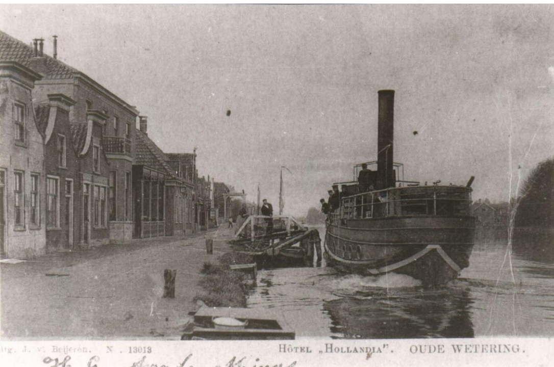
Een boot van Carsjens in het begin van de vorige eeuw bij de aanlegsteiger van hotel Hollandia in Oude Wetering, ter hoogte van Veerstraat 8.