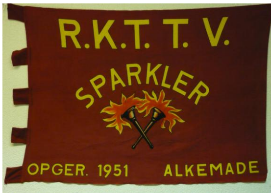
De vlag van Sparkler.

De Prancratiuszaal aan het Noordeinde was