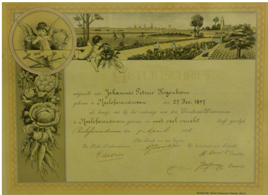
Getuigschrift van J.P. Hogenboom van de wintertuinbouw cursus van 1896.

“Aan de veiling nog steeds een groote aanvoer van andijvie, Chinesche kool en tomaten. Koude grond sla is nu op, en glassla is er nog heel weinig. Veel gaat weg voor export. De bloemen zijn nog steeds duur. Raynanten exportprijs 40 cent, Pulling en andere soorten brengen in de vrije markt tot 75 cent per stuk op”.